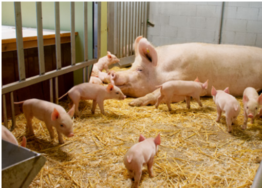
Abb. 1: Blick in eine Abferkelbucht

Das Sperma der SUISAG ist gesucht. Denn mit dem Einsatz von Schweizer Genetik lassen sich einmalig ruhige und fürsorgliche Muttersauen produzieren. Der kenianische Staat hat die Spermalieferung auch wegen des hohen Schweizer Gesundheitsniveaus zugelassen.