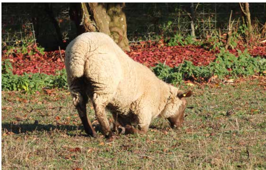
Kniendes Weiden – die typische Haltung eines an Moderhinke erkrankten Schafes.

Moderhinke ist eine schmerzhafte, ansteckende Klauenerkrankung und gilt weltweit als eine der wirtschaftlich bedeutendsten Erkrankungen der Schafe, die alle Rassen und Altersstufen betreffen kann. An Moderhinke erkrankte Schafherden erkennt man am knienden Weiden einzelner oder mehrerer Tiere. In Neuseeland mit rund 40 Mio. Schafen wurden die direkten Kosten als Folge von Moderhinke auf jährlich 60 bis 80 Millionen Franken geschätzt. Diese Kosten betreffen vor allem die Ertragsausfälle durch schlechtere Säuge- und Mastleistungen, reduzierte Fruchtbarkeit, vorzeitige Abgänge, tiefere Verkaufserlöse sowie Behandlungskosten. Neuere Studien aus der Schweiz zeigen, dass infizierte Lämmer rund 30 Tage später schlachtreif sind als gesunde und zusammen mit den Behandlungskosten die Einbussen bei einem Schafbestand von rund 400 000 Tieren jährlich ca. 6.6 Millionen CHF betragen.