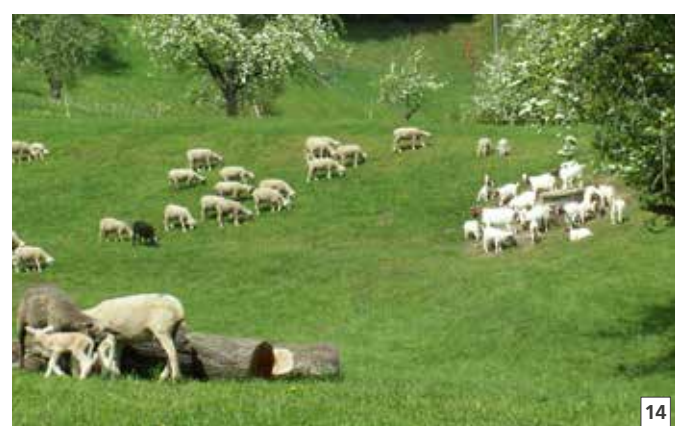
13 Schale eines an Moderhinke erkrankten Steinbockes.