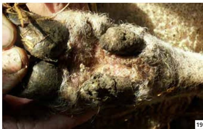
18 Anzeichen von Blauzungenkrankheit 19 Fussräude