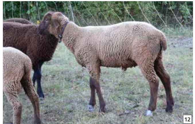
12 Klauenverband: Nur in Ausnahmefällen.

Bei Abwesenheit des Bakteriums Dichelobacter nodosus in einer Herde ist eine Erkrankung an Moderhinke nicht möglich. Das Bakterium ist für seine Vermehrung auf die Klaue angewiesen und kann auf Weiden nicht länger als 4 Wochen überleben.