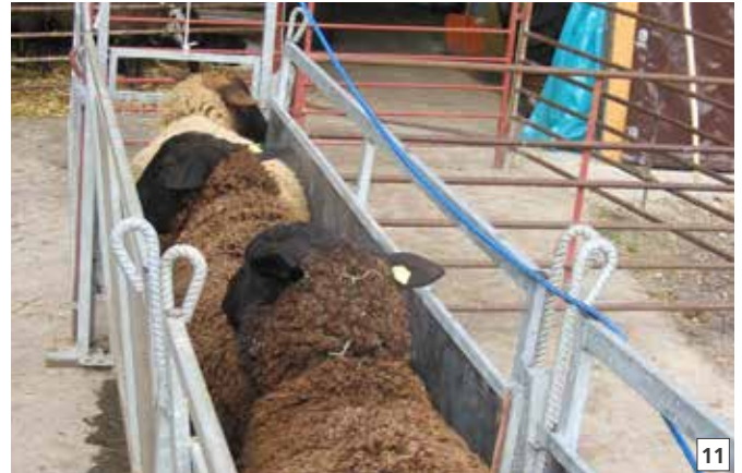
11 Klauenbad: Standbad während 5 bis 10 Minuten.

Bis zur vollständigen Abheilung werden Klauenschnitt und Klauenbad bei der Herde wöchentlich wiederholt. Für eine Sanierung sind mindestens 6 bis 8 Wiederholungen des Klauenbades nötig. Durch die Einstellung und Haltung der erkrankten Herde auf trockener Einstreu kann die Heilung beschleunigt werden.