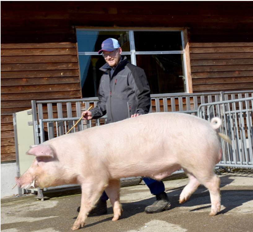
Verrat Landrace et le responsable de l'écurie dans la station IA de SUISAG