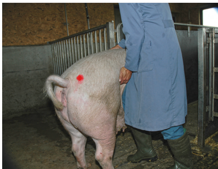
Illustr. 2: contrôle des chaleurs, test des flancs

Le meilleur moyen de réussir le déclenchement du reflexe d’immobilisation est l’imitation du comportement du verrat faisant des avances à la femelle: