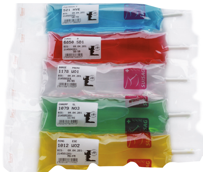
Illustr. 1: Blisters pour l'insémination artificielle

L'insémination artificielle est une méthode de reproduction efficace. Chez le porc on travaille avec du sperme frais qui se conserve entre 3 à 6 jours. Le sperme congelé est utilisé pour des raisons particulières comme par ex. des accouplements ciblés, exportation/importation ou comme réserve de gènes.