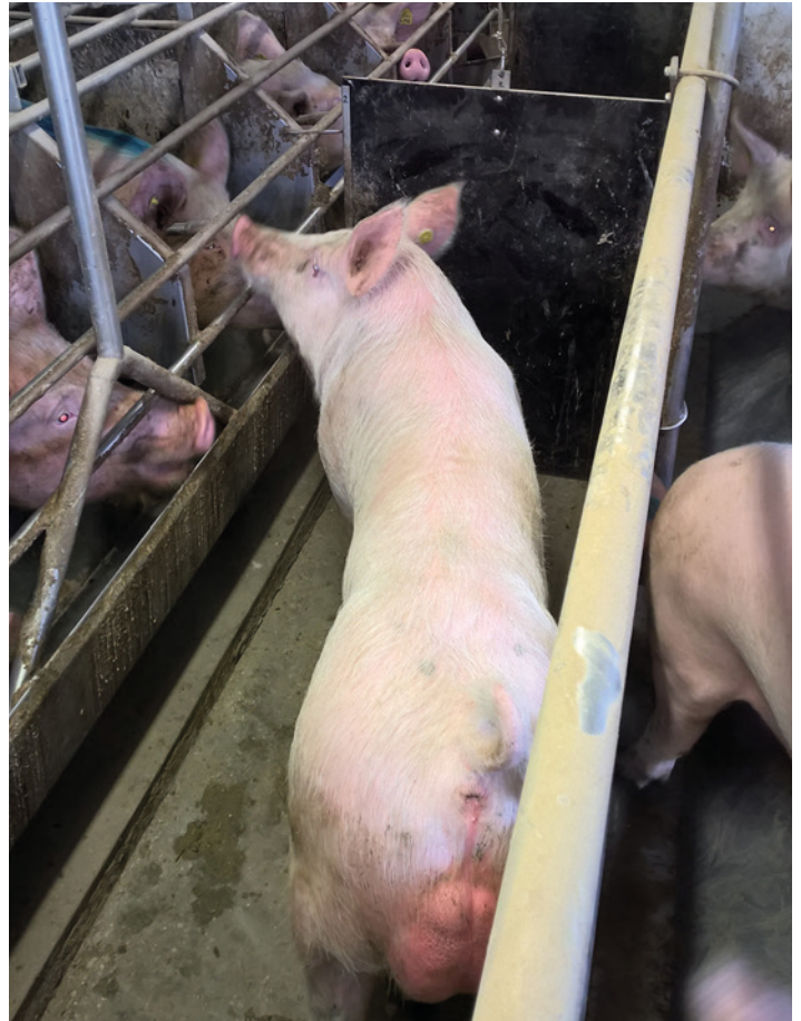
Illustr. 3: Verrat de stimulation pendant l'insémination artificielle

La gestion de saillie doit être adaptée au comportement individuel lors de la venue en chaleur des truies. En moyenne, l'ovulation a lieu 40 à 48 heures après la venue en chaleur. Des truies à œstrus précoce ont de longues chaleurs avec un réflexe d'immobilisation de plus de 72 heures. L'intervalle entre la première saillie et la saillie subséquente ne devrait pas dépasser les 16 à 24 heures. Chez les truies à œstrus précoce, la troisième saillie, à nouveau après 16 à 24 autres heures, peut être liée à des taux de mise bas nettement plus élevés. Les truies à œstrus tardif, avec un intervalle sevrage-chaieurs de plus de 6 jours, ont des chaleurs de courte durée. Dans ce cas, l'ovulation a lieu dans les premières 24 heures des chaleurs et l'insémination doit être effectuée immédiatement après le début du réflexe de l'immobilisation. Si ce réflexe persiste, l'insémination peut être répétée après 12 heures. .